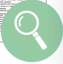
7 pagina's overzicht MantelzorgNL