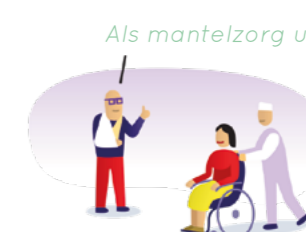
Als mantelzorg uitvalt