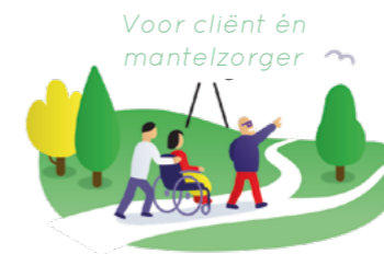
Voor cliënt én mantelzorger