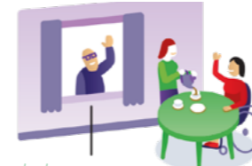
Mantelzorger kan er even uit

Respijtzorg is een tijdelijke en volledige overname van zorg met als doel de mantelzorger een adempauze te geven. Mantelzorgers kunnen zo de zorg langer volhouden en zelf nieuwe energie opdoen.